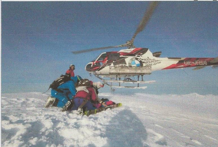
Gewinne einen Helitrip am Arlberg

Auch wenn der Arlberg unter Freeride Experten kein Secret Spot mehr ist, bleibt ein BMW Powder Ride Helitrip auf den Gipfel des 2.652 Meter hohen Mehsacks oder des Schneetäli (2.450 Meter) für jeden ein unvergessliches Erlebnis. Doch damit ist der BMW Freeride Day noch nicht zu Ende: Nach dem Mittag geht es mit dem Powder Spaß nahtlos weiter. Zusammen mit den Bergführern der Skischule Warth-Schröcken könnt ihr im weiteren Verlauf des Tages eure Spuren im Backcountry des Skigebietes ziehen.